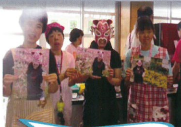
女子プロレスラーの方との記念撮影