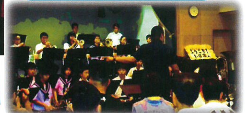
小原中学校吹奏楽部の迫力ある演奏にうっとり